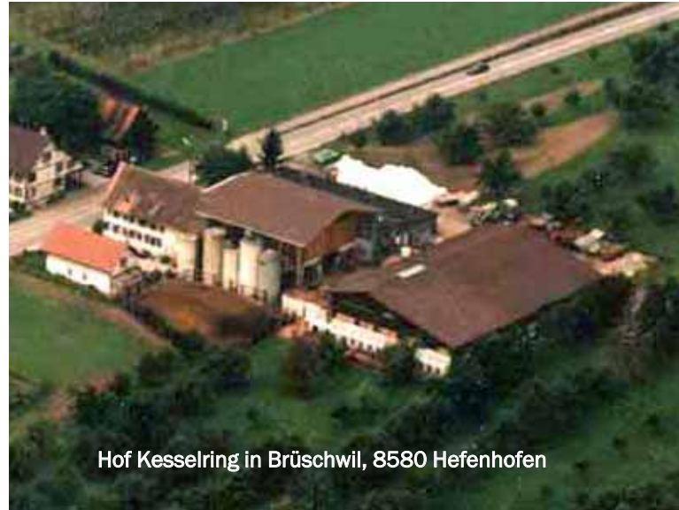
Hof Kesselring in Brüschwil, 8580 Hefenhofen