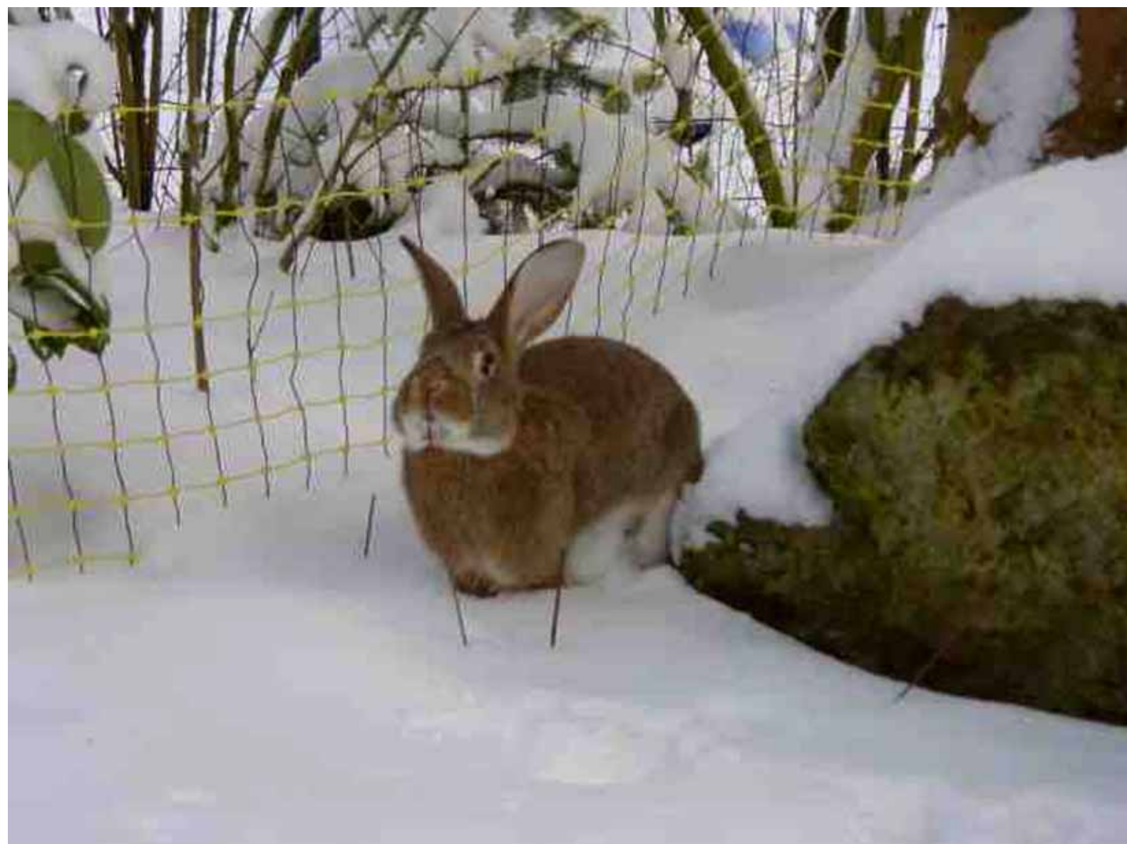
Kaninchen sind auch im Winter gerne im Freien.