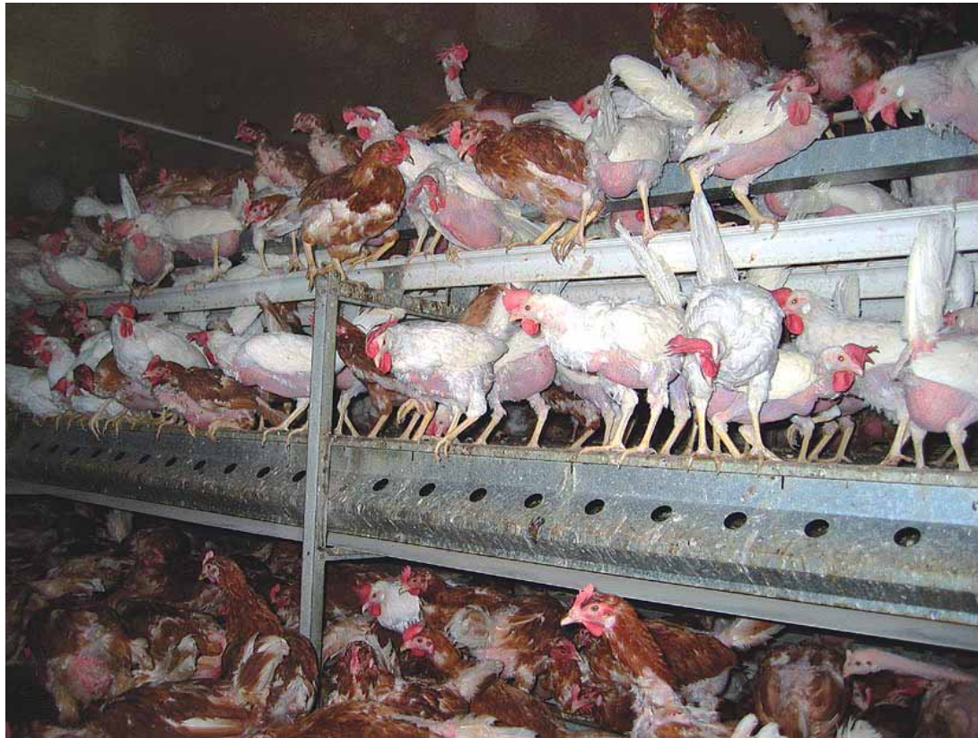
Abbildung: Typische Schweizer Legehennen-Fabrik mit sogenannter "Bodenhaltung": KZ-artige Zustände sind üblich und von den Behörden toleriert ( www.vgt.ch/doc/huehner ).

www.vgt.ch/news2006/060715-gottlieber.htm