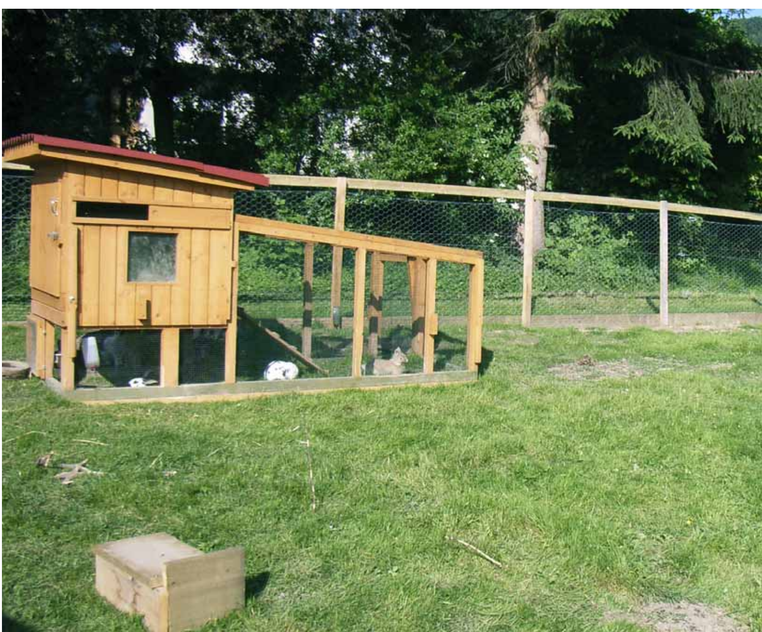
Tierfreundliches Kaninchen-Freigehege in Itaslen

Herzlose Züchter halten Kaninchen immer noch wie Plüschtierechen lebenslanglich in Kästen und Käfigen. Das ist brutale Tierquälerei - vom Bundesrat leider immer noch erlaubt mit Rücksicht auf die Tierversuchsindustrie, welche bei der Haltung ihrer Versuchskaninchen sparen will, während ihre Manager Millionen abzocken.