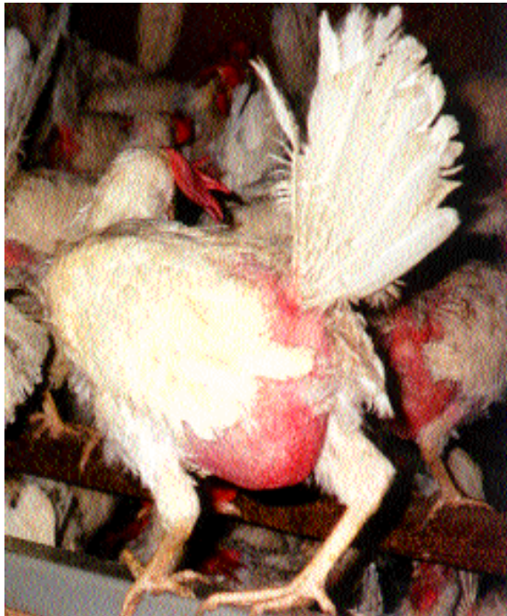
er Hühner in "Bodenhaltung"