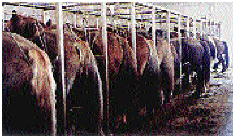
PMU-Tierfabrik: Schwangere Stuten in Daueranbindung mit angehängten Urinflaschen

In der amerikanischen Medikamentenwerbung wird behauptet, daß die «Stuten hochgeschätzt sind und gut versorgt werden» und man zitiert den «Empfohlenen Praxiskodex für die Pflege und Handhabung von Pferden in PMU-Betrieben» als Beweis für die ausgezeichnete Pflege. Leider verfügt der Praxiskodex über geradezu rührend niedrige Standardanforderungen, ist rein freiwillig und wird bestenfalls ganz locker gehandhabt bzw. umgesetzt. Im Jahre 1970 sah sich die PMU-Indu-