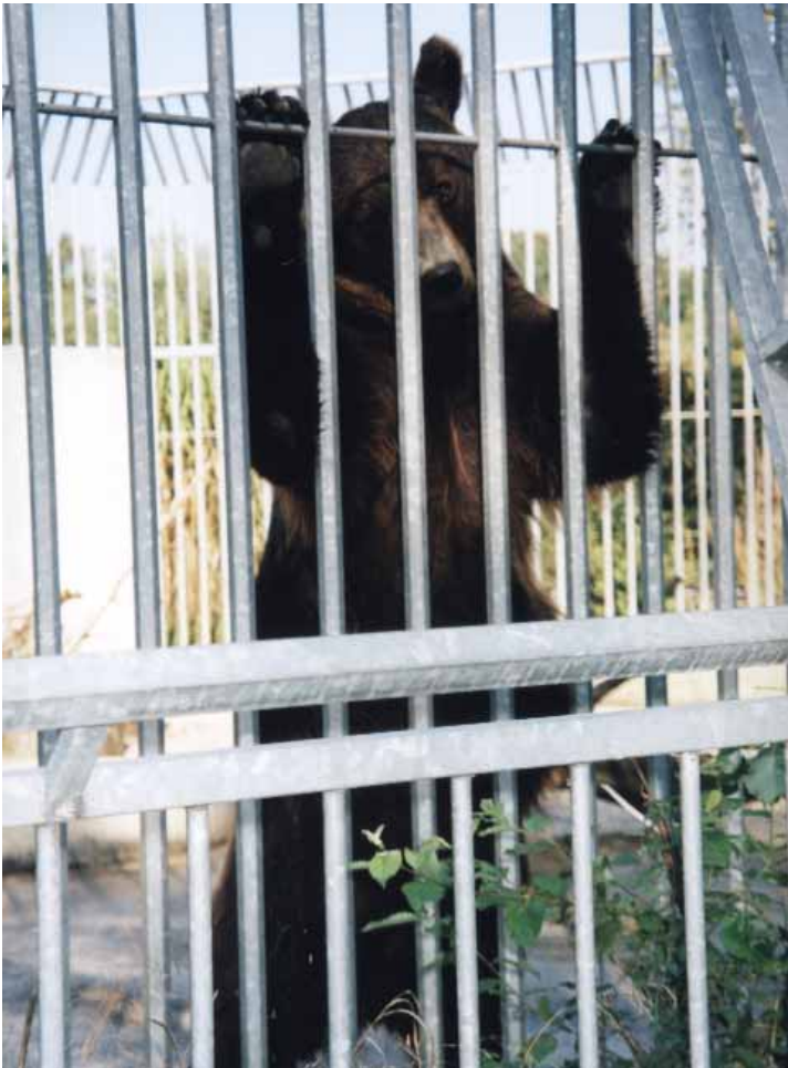
Unten: Der Gegensatz: Tierfreundliches Bärengehege im Tierpark Langnau der Stadt Zürich