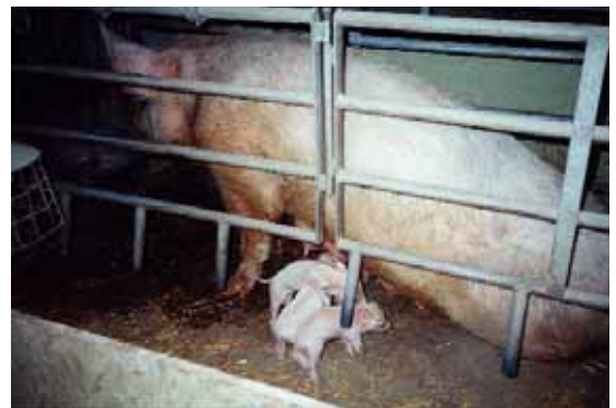
Tierquälerei im Kloster Fahr Siehe im Internet unter www.vgt.ch/vn/9905/fahr.htm

Aus einem Brief an die Herren vom Kloster Einsiedeln: Nichts ist schlimmer als wenn Menschen anderen Lebewesen Leid und Qualen zufügen. Da ich eine Gläubige Person bin, an Gott glaube und seine Gesetze nach bestem Gewissen einhalte, kann ich solche Missstände in Kloster-Betrieben