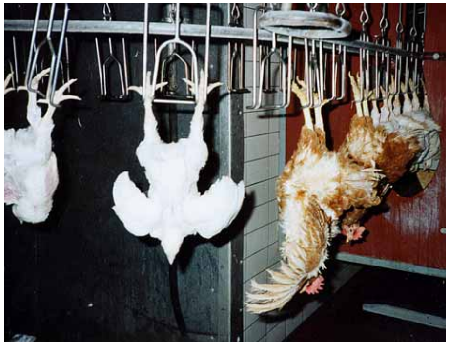
Verzweifelter Kampf: In Panik versuchen sich die Tiere zu befreien.