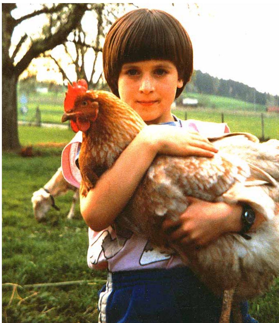
Die Illusion vom glücklichen Schweizerhuhn

anderem) hat unter den heutigen Umständen der tierquälerischen Massenzucht von Hühnern, der Überzüchtung und industriellen Fütterung sowie der Massen-Hühnerhaltung auch bei Freilandhaltung keine Berechtigung mehr. Dieses Wort sollte aus dem Wortschatz aller gestrichen werden, deren Anliegen ein ethisch begründeter Tierschutz ist. Umso verfehlter ist es, dass der Schweizerische Vegetarier-Verein SVV, der sonst stets eine vegane Lebensweise propagiert, sein V-Label für Ei-haltige Migros-Produkte zur Verfügung stellt. Wir haben das scharf kritisiert, weil dies den Kampf des VgT gegen den Eier-Konsum behindert. Doch der vom Migro um den Finger gewickelte SVV hält stur an diesem Ovo-Vegetarismus-Label fest. Für die Lizenzgebühren, die er damit von Migros kassieren kann, nimmt er es rücksichtslos in Kauf, dem VgT Steine in den Weg zu legen. Wir haben deshalb die Zusammenarbeit mit dem SVV eingestellt und werden nicht nachlassen, die Konsumenten vor diesem besonders raffinierten, hinter dem SVV-Feigenblatt versteckten Migros-Trick zu warnen.